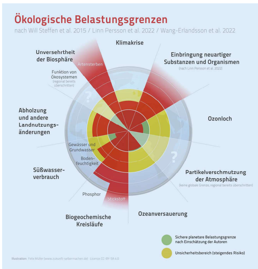
Abb. 1 ▲ Visuelle Darstellung der ökologischen Belastungsgrenzen (englisch: „planetary boundaries“). (Nach Will Steffen et al. [31], Linn Persson et al. [19] und Wang-Erlandsson et al. [26], aus [29], mit freundl. Genehmigung, © Felix Joerg Mueller [www.zukunft-selbermachen.de], Lizenz: CC BY-SA 4.0, https://creativecommons.org/licenses/by-sa/4.0/deed.de , alle Rechte vorbehalten)

Klimaschutzziele stellt eine gesamtgesellschaftliche Aufgabe dar.