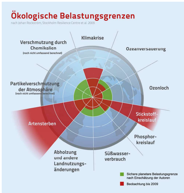
Abb. 2 ▲ Visuelle Darstellung der ökologischen Belastungsgrenzen („planetary boundaries“). (Nach Johan Rockström et al. [22], aus [30], mit freundl. Genehmigung, © Felix Joerg Mueller [www.zukunft-selbermachen.de], Lizenz: CC BY-SA 4.0, https://creativecommons.org/licenses/by-sa/4.0/deed.de , alle Rechte vorbehalten)